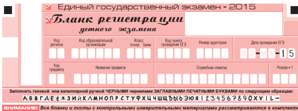
Рис. 12. Верхняя часть бланка регистрации устного экзамена

В верхней части бланка регистрации устного экзамена (рис. 12) расположены: вертикальный и горизонтальный штрихкоды, поля для рукописного внесения информации, строка с образцами написания символов, поле для служебной отметки и резервное поле.